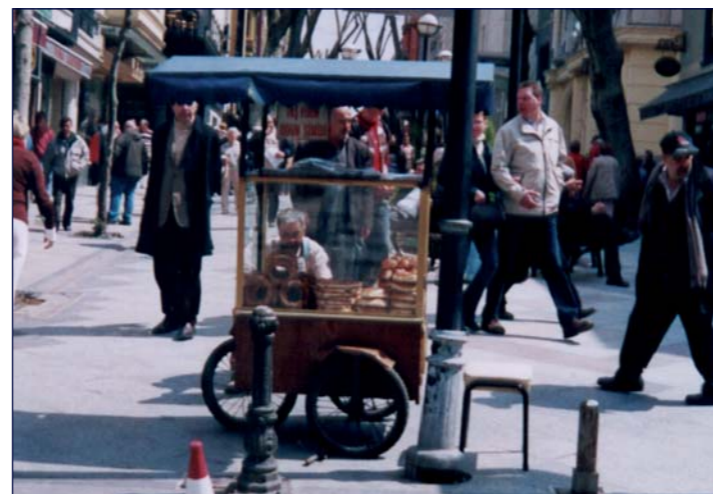
Ein typischer Backwarenverkäufer auf der Straße zum Großen Basar in Istanbul