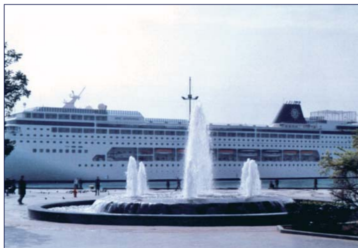
MSC Sinfonia am Kai von Jalta