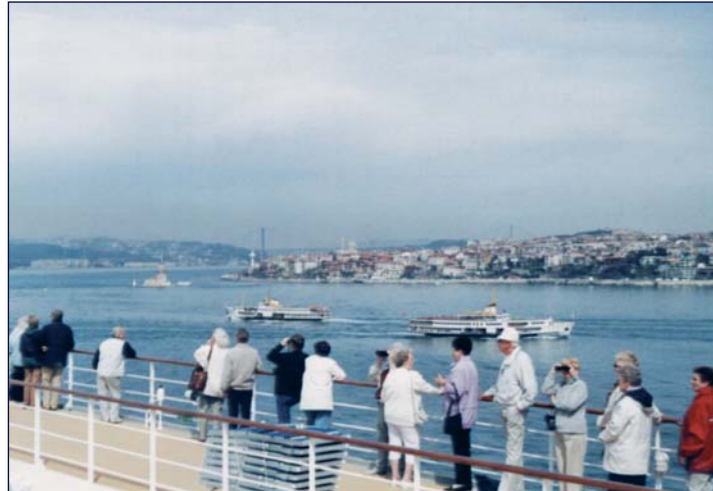
Durchquerung des Bosphorus, gegenüber Istanbul – ein wunderschönes Erlebnis!