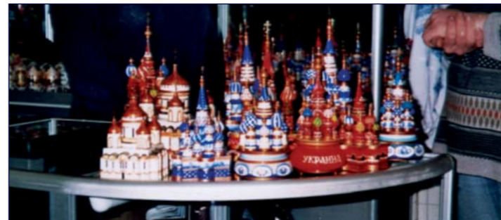
Im ukrainischen Souvenirgeschäft des Hafenbahnhofs von Jalta