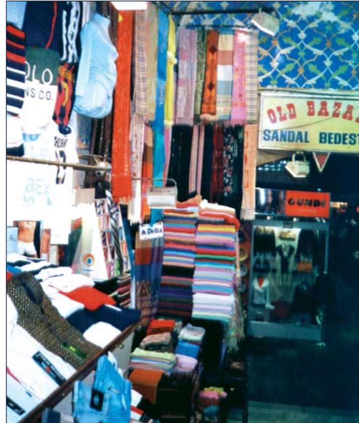
Stoffhändler im Großen Basar von Istanbul