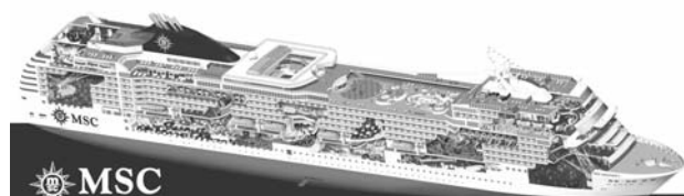
Schiffsquerschnitt MSC Magnifica (100cm breit, 40cm hoch)